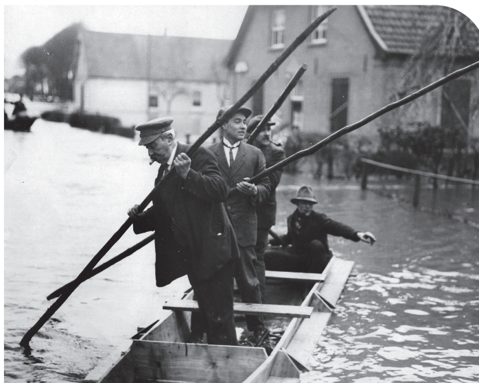
▲ In de Gelderse geschiedenis was de dreiging van hoogwater en overstromingen voortdurend dichtbij.