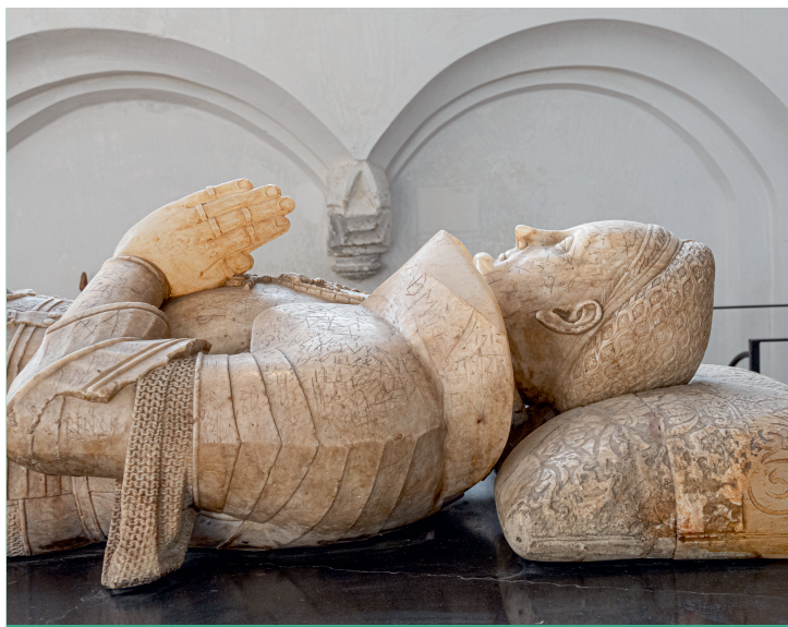
▲ Dit praalgrafin de Eusebiuskerk was de laatste rustplaats van de beroemde hertog Karel van Gelre.